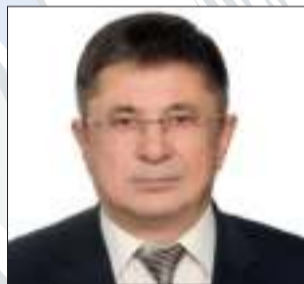
Вячеслав Гилязитдинов председатель госкомитета Республики Башкортостан по предпринимательству и туризму

Уважаемые предприниматели! Поздравляю вас с профессиональным праздником — Днем российского предпринимательства!