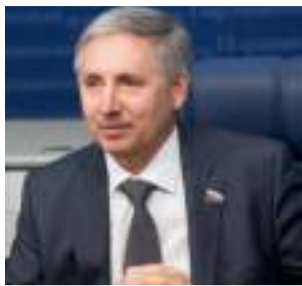
Рафаэль Марданшин председатель Совета Башкортостанского регионального отделения «Деловая Россия», Депутат Государственной Думы ФС РФ

Уважаемые коллеги! Примите искренние поздравления с профессиональным праздником – Днем российского предпринимательства!