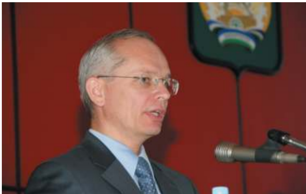
Приводим выдержки из выступления Рустэма Марданова, первого заместителя Премьер-министра Правительства Республики Башкортостан.